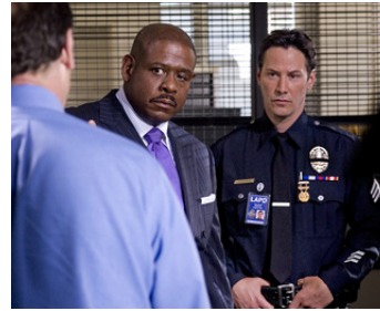
2008 AU BOUT DE LA NUIT (Street Kings) de David Ayer avec Keanu Reeves