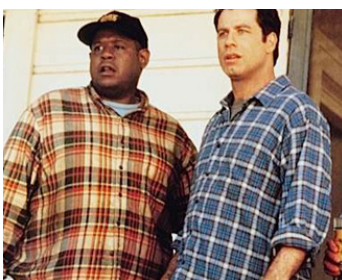
1996 PHÉNOMÈNE (Phenomenon) de John Turteltaub avec John Travolta