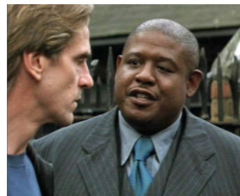
2001 VENGEANCE SECRÈTE (The Fourth Angel) de John Irvin avec Jeremy Irons