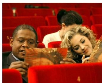
2005 MARY (Mary) d'Abel Ferrara avec Marion Cotillard