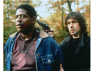
1992 THE CRYING GAME (The Crying Game) de Neil Jordan avec Stephen Rea