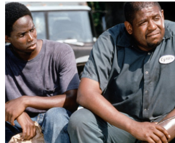
1995 SMOKE (Smoke) de Wayne Wang et Paul Auster avec Harrold Perrineau