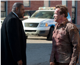
2013 LE DERNIER REMPART (The Last Stand) de Kim Jee-woon avec Arnold Schwarzenegger