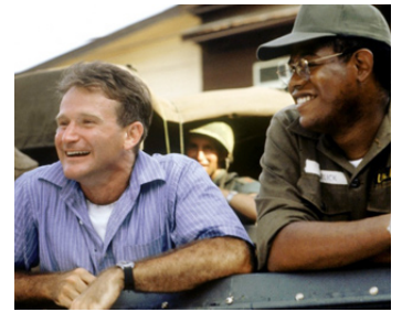
1987 GOOD MORNING VIETNAM (Good Morning Vietnam) de B. Levinson avec Robin Williams