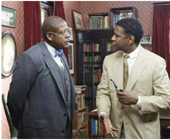
2007 LE GRAND DÉBAT (The Great Debaters) de et avec Denzel Washington