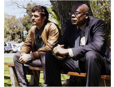
2013 ZULU (Zulu) de Jérôme Salle avec Orlando Bloom