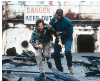
1994 BLOWN AWAY (Blown Away) de Stephen Hopkins avec Jeff Bridges