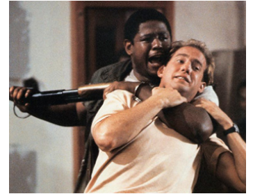
1990 DEUX FLICS À DOWNTOWN (Downtown) de Richard Benjamin avec Anthony Edwards