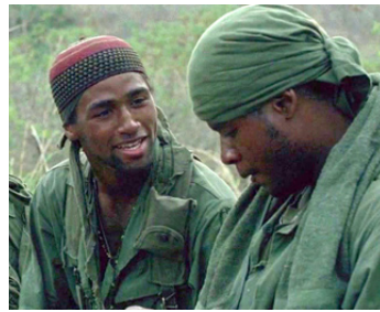
1986 PLATOON (Platoon) d'Oliver Stone avec Reggie Johnson