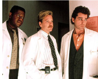
1992 ARTICLE 99 (Article 99) de Howard Deutch avec Kiefer Sutherland, Ray Liotta