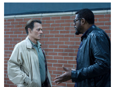
2018 LA CITÉ DES MENSONGES (City of Lies) de Brad Furman avec Johnny Depp