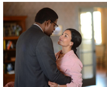
2014 LA VOIE DE L'ENNEMI (Two Men in Town) de Rachid Bouchareb avec Dolores Herera