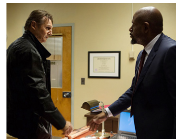
2015 TAKEN 3 (Taken 3) d'Olivier Megaton avec Liam Neeson