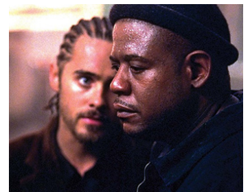
2002 PANIC ROOM (Panic Room) de David Fincher avec Jared Leto