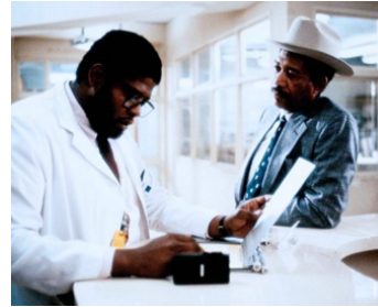
1989 JOHNNY BELLE GUEULE (Johnny Handsome) de Walter Hill avec Morgan Freeman