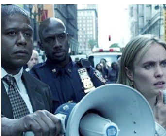
2002 PHONE GAME (Phone Booth) de Joel Schumacher avec Radha Mitchell