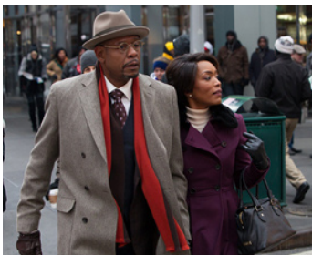
2013 BLACK NATIVITY (Black Nativity) de Kasi Lemmons avec Angela Bassett