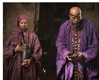
2017 BLACK PANTHER (Black Panther) de Ryan Coogler avec Angela Bassett