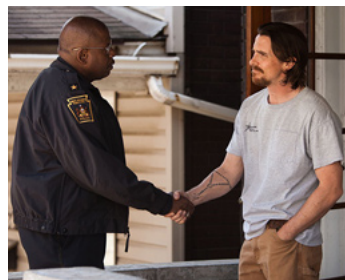
2013 LES BRASIERES DE LA COLÈRE (Out of the Furnace) de Scott Cooper avec Christian Bale