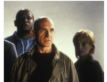
1995 LA MUTANTE (Species) de Roger Donaldson avec Ben Kingsley, Marg Hallenberger