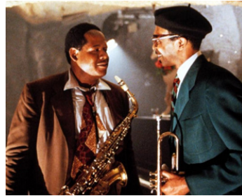
1988 BIRD (Bird) de Clint Eastwood avec Samuel E. Wright