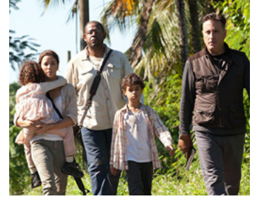
2012 A DARK TRUTH (A Dark Truth) de Damian Lee avec Eva Langoria, Andy Garcia