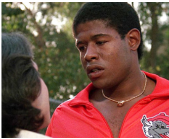
1987 ÇA CHAUFFE AU LYCÉE RIDGEMONT (Ridgemont) d'Amy Heckerling