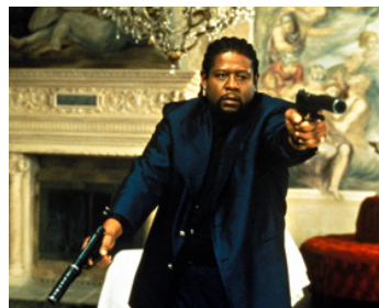
1999 GHOST DOG, LA VOIE DU SAMOURAÏ (Ghost Dog, the Way of the Samurai) de Jim Jarmusch