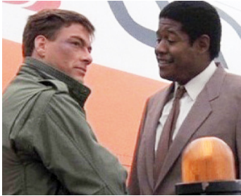
1988 TOUS LES COUPS SONT PERMIS (Bloodsport) de Newt Arnold avec Jean-Claude Van Damme