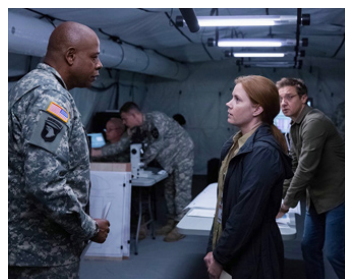
2016 PREMIER CONTACT (Arrival) de Denis Villeneuve avec Amy Adams, Jeremy Renner