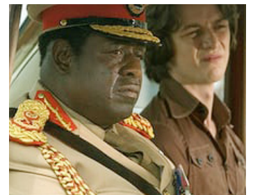
2006 LE DERNIER ROI D'ÉCOSSE (The last King of Scotland) de Kevin McDonald avec James McAvoy