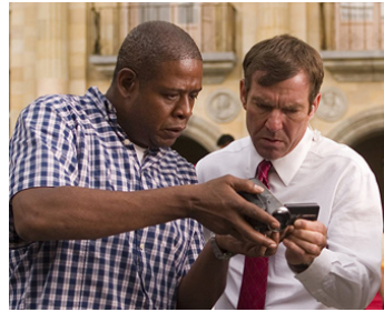
2008 ANGLES D'ATTAQUE (Vantage Point) de Pete Travis avec Dennis Quaid