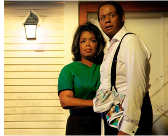
2013 LE MAJORDOME (The Butler) de Lee Daniels avec Oprah Winfrey