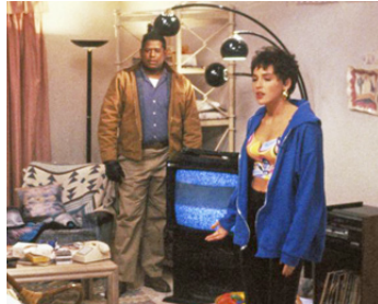
1991 HIT MAN, UN TUEUR (Diary of a Hitman) de Roy London avec Sharon Stone