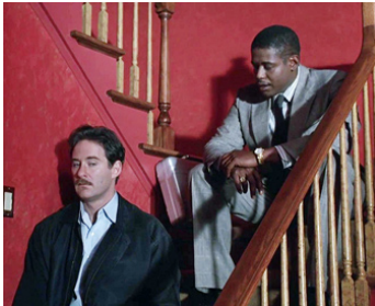
1992 JEUX D'ADULTES (Consenting Adults) d'Alan J. Pakula avec Kevin Kline