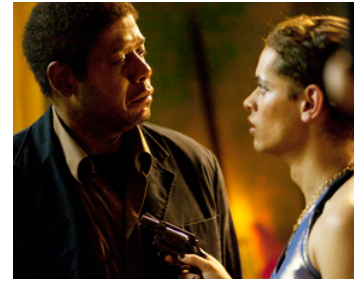
2008 POINTS DE RUPTURE (Powder Blue) de Timothy Linh-Bui avec Eddie Redmayne