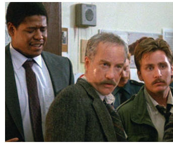
1987 ÉTROITE SURVEILLANCE (Stakeout) de J. Badham avec R. Dreyfuss, Emilio Estevez