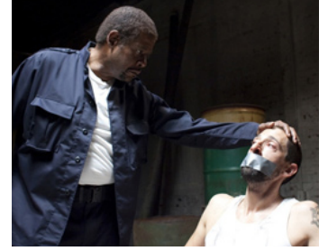
2010 THE EXPERIMENT (The Experiment) de Paul Scheuring avec Adrien Brody