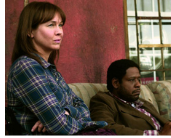
2010 MY OWN LOVE SONG (My Own Love Song) d'Olivier Dahan avec Renee Zellweger